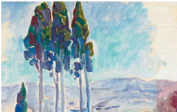
Το «Μικρό εκκλησάκι της Κεφαλονιάς» του Κ. Παρθένη

Η Συλλογή Βογιατζόγλου καλύπτει 140 χρόνια ιστορίας της νεοελληνικής τέχνης και δεκάδες εκπροσώπους της, με αρχαιότερο έργο την ακουαρέλα του Αλέξη Μπαρκώφ, Φινλανδού ζωγράφου που έζησε σε Αθήνα και Θεσσαλονίκη, και ολοκληρώνεται (προς το παρόν) με τον Φασιανό, του οποίου διαθέτει πάνω από τριάντα έργα. Κι άλλοι καλλιτέχνες, όπως ο Μάκης Θεοφυλακτόπουλος, έχουν προνομιακή μεταχείριση, με πληθώρα έργων, κάτι που δημιουργεί κενά και άνισες εκπροσωπήσεις.