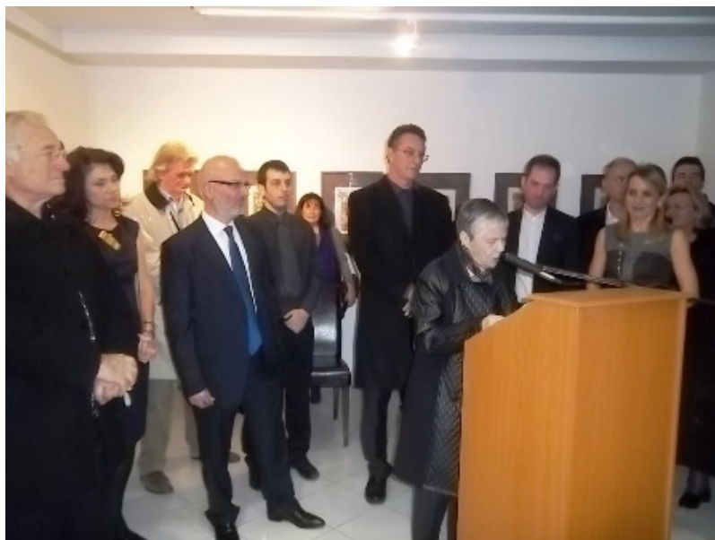
η Πρύτανης κα. Ελένη Γλύκατζη-Αρβελέρ